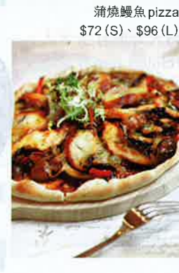
蒲燒鰻魚 pizza $72 (S)、$96 (L)