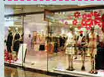
Viva Violet 旺角新世紀廣場 233-234 號舖 2576 2889

來自日本的 Viva Violet，今年4月才登陸香港。Viva Violet 設計細緻可愛，線條乾淨俐落，運用蝴蝶結、通花、絲帶、喱士綴邊等 details，加強甜美的感覺。滲有點點法式味道的連身裙及針織上衣，是年輕 OL 們上班服的首選。