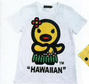
白×七彩夏威夷鴨仔print tee $399