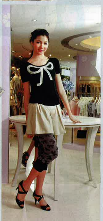
黑 x 白色蝴蝶結 knit top $328 杏色短褲 $590 黑 x 灰色蝴蝶結 leggings $279 黑色漆皮 sandals $553