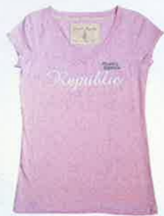
粉紅色字 print tee $260