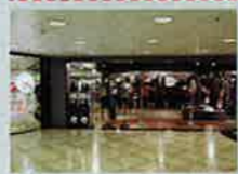
2% 旺角新世紀廣場 369-370 號舖 2390 7262

2% 於新世紀廣場的專門店應有盡有，除了甜美 sexy 的 2% 外，更有簡約 OL 服 + - x ÷ 和男裝 th: 等，近日 final sale 減價更低至 3 折，非常抵買。