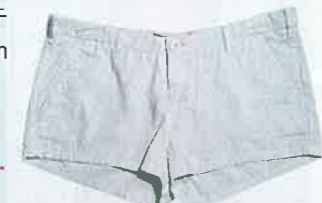
白色 hot pants $360