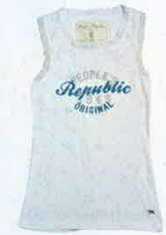
白色 lace 邊字 print tank top $240