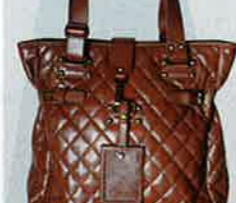
+ - x ÷ 啡色 quilted 手袋 $399