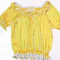
Hibiscus 黃 x 白色 ruffles top $1,088