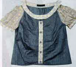
灰 x 米色圖案 top $490