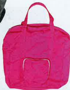
螢光粉紅色尼龍 tote bag $195