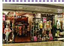
Jolie J. 旺角新世紀廣場 232 號舖 2628 9978

Select shop Jolie J. 除了售賣自家同名品牌外，更代理多個歐洲品牌如 Second Me、Hibiscus 和 Elegante，無論是型格的 casual wear，抑或是成熟的 party wear，也能在 Jolie J. 找到，衣服用上優質的布料和獨特的剪裁，展現女生自信的一面。