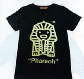
黑×金色獅身人面像鴨仔print tee $450