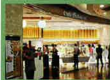
Café Balencia 旺角新世紀廣場 106 號舖 2628 3362