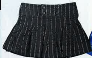
深灰色條子百褶裙 $400