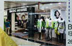
BASIC HOUSE 旺角新世紀廣場323號舖 2628 9700

BASIC HOUSE旗下有3條支線，MD SIGN系列大玩crossover，SERIES系列的设计則以當季流行元素為主打，而LAB則是一些basic服飾，適合不同styles的女生。