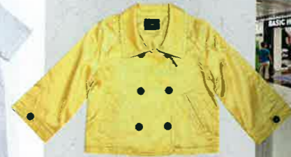
黃色仔襟 jacket $500