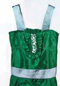
Hibiscus 綠色 satin 閃石 top $850