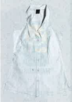
2% 白色入膊 shirt $81