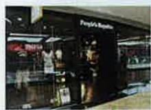
People's Republic 旺角新世紀廣場 325 號舖 2628 9332

走進 People's Republic，好像去到美國的時裝店。其實它是不折不扣的本地品牌，07年4月才正式成立，設計以 casual 服為主，走美國休閒風格，T-shirt、背心、短裙、sweater、牛仔服飾一應俱全，而其剪裁較為 slim cut，最適合愛穿貼身衣服的纖瘦女生。