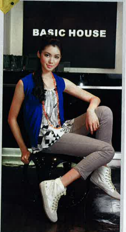
寶藍色背心外套 $350 黑×白色print tank top $150 灰色skinny jeans $350 米×灰色人造皮sneakers $400