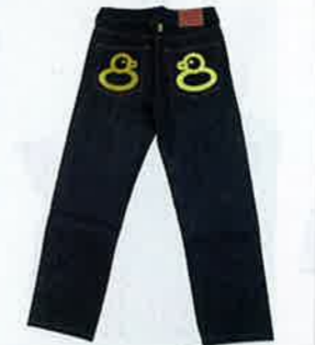
深藍×黃色鴨仔刺繡圖案牛仔褲 $1,190