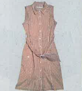
紅×白色條子 shirt dress $500