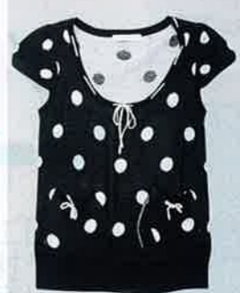
黑 x 白色波點 knit top $307