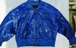
2% 寶藍色 satin jacket $111