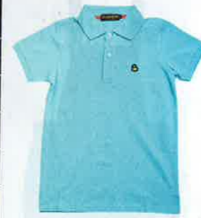
粉藍色鴨仔logo polo shirt $450