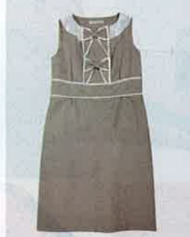
卡其色蝴蝶結 one-piece $826