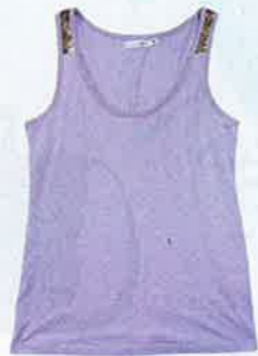
粉紫色綴珠片 tank top $196