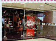
http://www.izzue.com 旺角新世紀廣場 318-319號舖 2787 0183