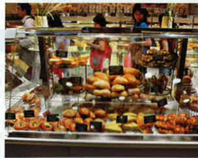
多款特色麵包任君選擇，如想坐在 café 慢慢歇便要 order 1 杯飲品。

位於廣場地面的 Café Balencia，一面是售賣麵包蛋糕的 bakery，一面是吃日式 pizza、意粉的迷你 café，每天均人頭湧湧，不少人 shopping 完後，均喜歡在此歇一歇。