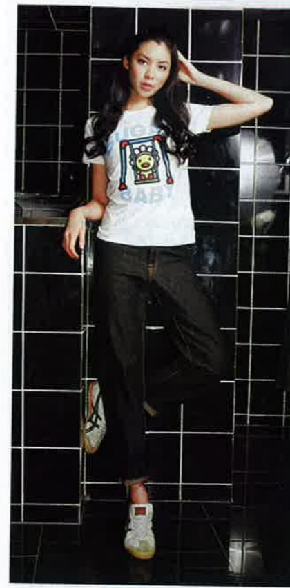
白×七彩鞦韆鴨仔print tee $399 深藍色牛仔褲 $1,190 白×綠色sneakers (Stylist's own)