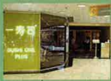
一壽司+ 旺角新世紀廣場 331-335 號舖 2110 9922