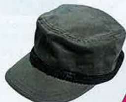
軍綠×黑色綴珠片 cap $156

I.T旗下的品牌 http://www.izzue.com ，一直是不少時尚女生的心頭好，當季人气的元素均可在izzue找到。好像今季大熱的螢光色調便是izzue的主打之一，無論衣物和配飾也換上螢光新裝，讓你「螢」足整個炎夏。