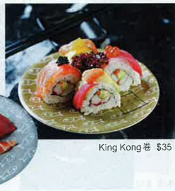
King Kong 卷 $35