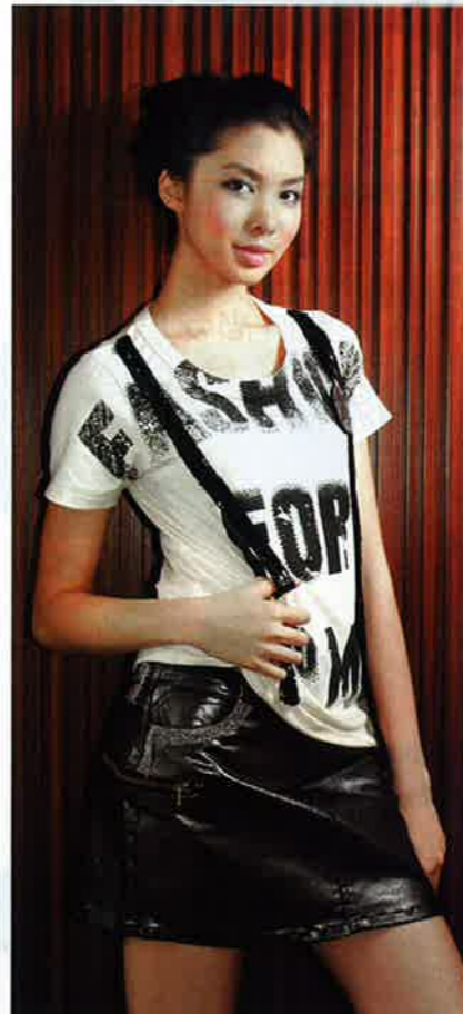
Second Me 米 x 黑色字 print 珠片吊帶 tee $699 Second Me 黑色令面 miniskirt $699