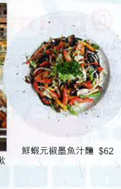
鮮蝦元椒墨魚汁麵 $62