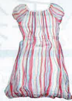
Hibiscus 紅 x 粉藍 x 白色條子 chiffon one-piece $980