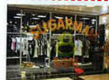
SUGARMAN 旺角新世紀廣場386A舖 2628 3012

SUGARMAN是本地品牌THE FIRST SHOP其中1條支線，用上可愛的鴨仔為icon，作為T-shirt和牛仔褲的圖案。鴨仔更不時扮鬼扮馬，大玩cosplay，好像化身成夏威夷女郎、獅身人面像等，casual中充滿玩味。