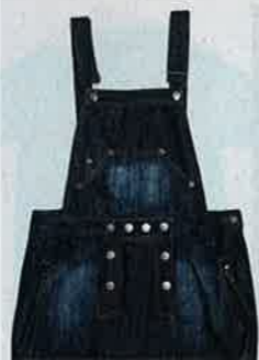
2% 深藍色牛仔 overalls $221