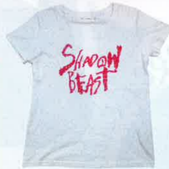
白×螢光粉紅色綴閃珠片字print tee $210