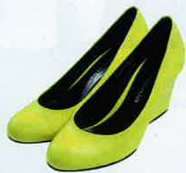
螢光黃色 wedges $420