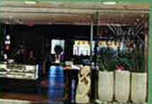
峇里園 旺角新世紀廣場601號舖 2619 1926