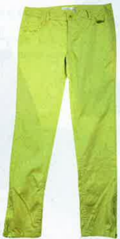
螢光黃色 color pants $336