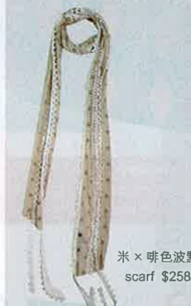
米 x 啡色波點 scarf $258