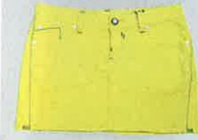
螢光黃色 miniskirt $350