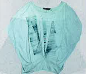
粉綠色蠟燭袖 top $250