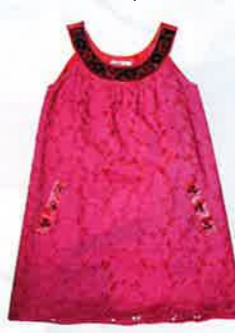
Jolie J. 桃紅色通花 one-piece $950